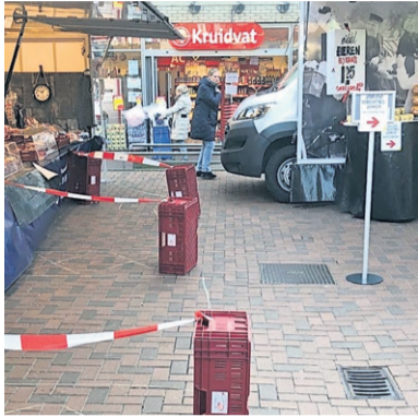
De markt in Twello is vanwege het coronavirus eenrichtingsverkeer. Er

hangen bordjes bij de ingangen om de wandelrichting aan te geven. Dit is altijd met de klok mee. Op deze manier is het gemakkelijker om een veilige afstand van elkaar te houden.