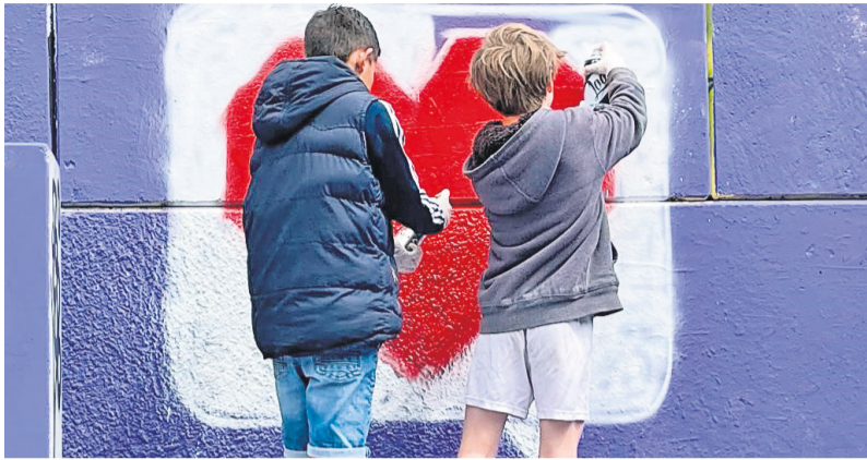
In het kader van het Jaar van Elkaar werd vorig jaar tijdens NLdoet bij Het Honk in Twello een stoer graffiti kunstwerk gemaakt.

Doe mee met een NLdoet-activiteit op 11 of 12 maart