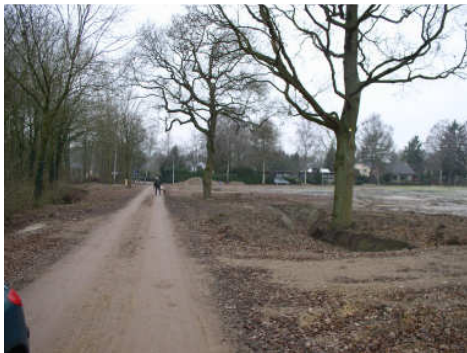
Beeldbepalende bomen achter 't Holthuis.

Bij nieuw te ontwikkelen (woning) bouwlocaties mag alleen structureel groen onderdeel uitmaken van het stedenbouwkundige ontwerp.