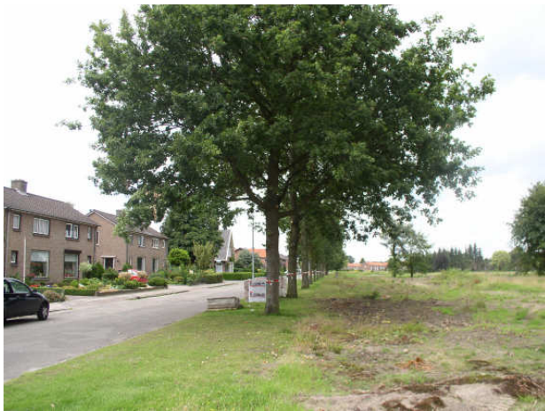
Integratie van bestaand groen in nieuwe wijken

Daarnaast zal het vaak voorkomen dat er nieuw groen wordt aangelegd. Vooraf zal dit groen moeten worden beoordeeld vanuit de uitgangspunten zoals verwoord in deze visie. Het is van belang om naast deze uitgangspunten ook de beheerskosten inzichtelijk te maken. Uitgangspunt is dat beheer van dit nieuwe groen de eerste twee jaar onderdeel vormt van de uitbreiding en dat de kosten onderdeel uitmaken van de uitbreiding. Na twee jaar worden de beheerskosten opgenomen in de reguliere beheersbegroting.