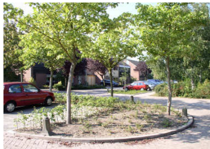
wijk- en buurtgroen