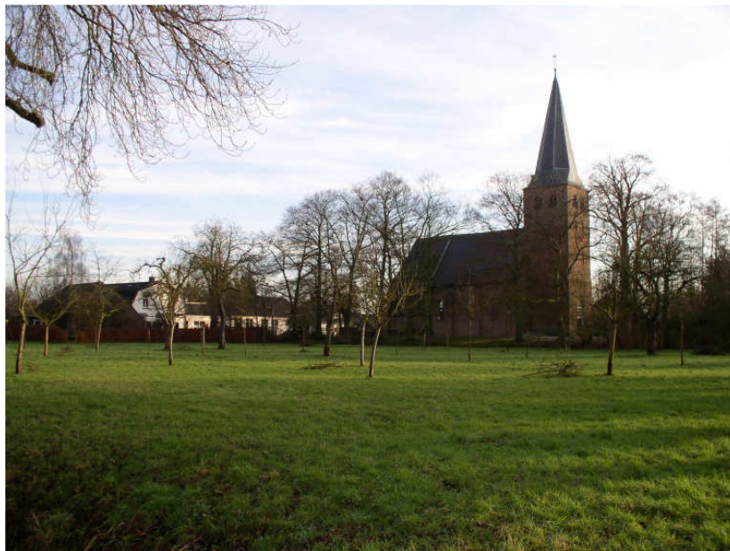
herkenbaar Nijbroek; de Bongerd

Om deze bezuinigingen te kunnen realiseren zijn middelen nodig. Hiervoor is onder nieuwe prioriteiten 2006 exploitatie een bedrag beschikbaar gesteld van € 25.000,-- in 2006 en € 30.000,-- voor de jaren 2007, 2008 en 2009. Het gaat hier om een zogenaamde voorinvestering die het mogelijk maakt om op termijn een flinke bezuiniging door te kunnen voeren op het complete beheer van het groen.