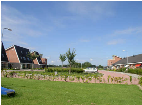
Dillestraat Voorst; wijk- en buurtgroen, basis onderhoud