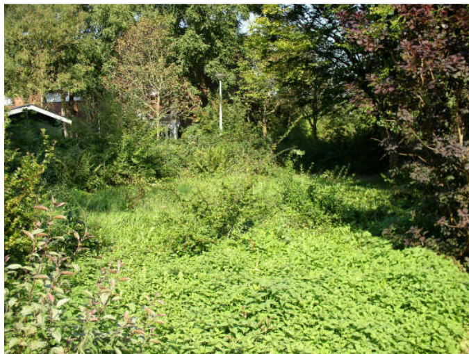
versleten en veel van hetzelfde groen

Door de openbare ruimte te verdelen in te onderscheiden eenheden met een eigen identiteit kan hierop het juiste beheer worden afgestemd. Dit beheer zal een intensief, normaal of extensief karakter hebben. Door dit op een beheerkaart aan te geven en hierop duidelijk de onderhoudsmechanismen weer te geven kan helder worden gecommuniceerd met bewoners over het te voeren groenbeheer. Daarnaast kan bij een gedifferentieerd groenbeheer door het bestuur op hoofdlijnen (bij) sturing worden gegeven aan het te voeren beheer, inclusief de consequenties hiervan, iets wat nu niet mogelijk is.