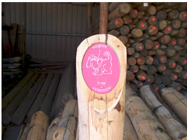
Het voorster hondenbord

Deze huidige situatie houdt in dat er wordt gereageerd op klachten van burgers. Zoals beschreven gaan de meeste klachten over overlast van honden op speel- en trapveldjes. De buitendienst van de gemeente gaat in dergelijke gevallen over tot plaatsing van een zogenaamd hondenbord. In de meeste gevallen is met deze maatregel een groot deel van de klacht verdwenen.