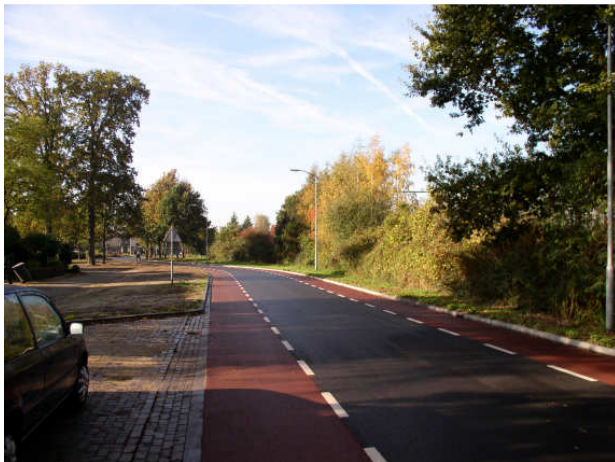
Dorpsranden; extensief onderhoud