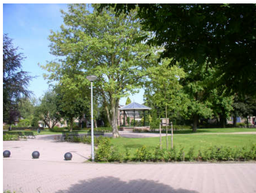
Lugtmeijerplantsoen Voorst; intensief onderhoud