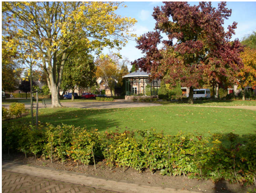
Herkenbaar Voorst (muziek tent Voorst)

De huidige situatie zal per dorp of kern worden geanalyseerd. Hierdoor kan een vergelijk worden gemaakt tussen de huidige situatie en de visie en worden voorstellen gedaan voor herinrichting, afstoten of een andere, veelal meer doelmatige vormen van beheer. De beheersvisie is niet alleen gericht op kosten van beheer en onderhoud, maar juist ook naar ruimtelijke en voor Voorst herkenbare kwaliteit, een onderwerp dat hoog op de gemeentelijke agenda staat.