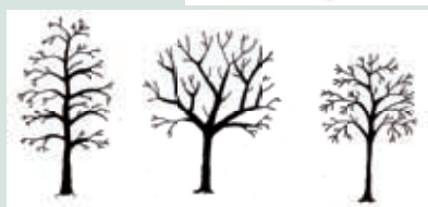
Peer, appel, pruim of kers