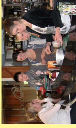
Foto bijeenkomst: Tactus maakt alcoholvrije cocktails met leerlingen van het ROC Apeldoorn, afdeling Horeca.

Meer informatie: Tactus Verslavingszorg, Sonja Basemans s.basemans@tactus.nl of Mireen Engelbaris m.engelbaris@tactus.nl