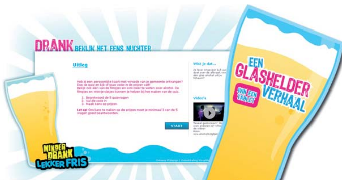
Voorzant van de actiewebsite en de flyer 'Een glashelder verhaal'.

Half april viel bij ongeveer 12.000 jongeren van 14 en 15 jaar uit de regio Achterhoek en Stedendriehoek een envelop van hun gemeente, met daarin een flyer over alcohol, op de deurmat.