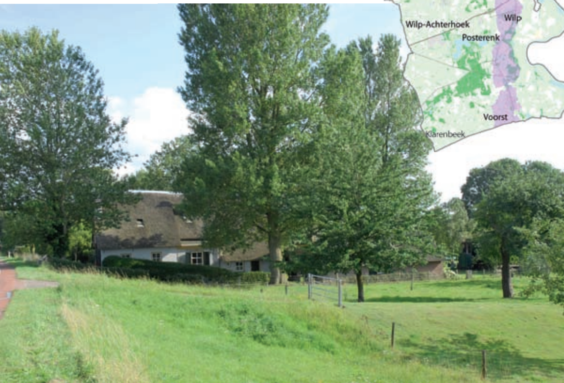
Boerderij Swarte Peert bij Terwolde

Vanaf Twello ligt richting het noorden tot en met het gebied rond Wapenveld een aaneengesloten oeverwal langs de IJssel. De rivier is hier redelijk stabiel geweest. Dit in tegenstelling tot een meer versnipperde en onduidelijke overwal ten zuiden van Twello. Om overstromingen tegen te gaan werden aan de rivierzijde dijken op de oeverwal aangelegd. Bijzonder is de aanwezigheid van allerlei bijzondere landschapselementen, zoals kolken, gemalen en landgoederen. Een bijzonder kenmerk zijn de IJsselhoeven op de oeverwal.