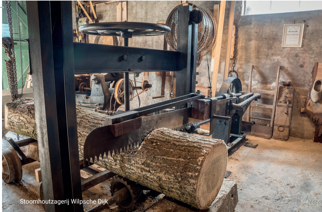
Stoomhoutzagerij Wilpsche Dijk