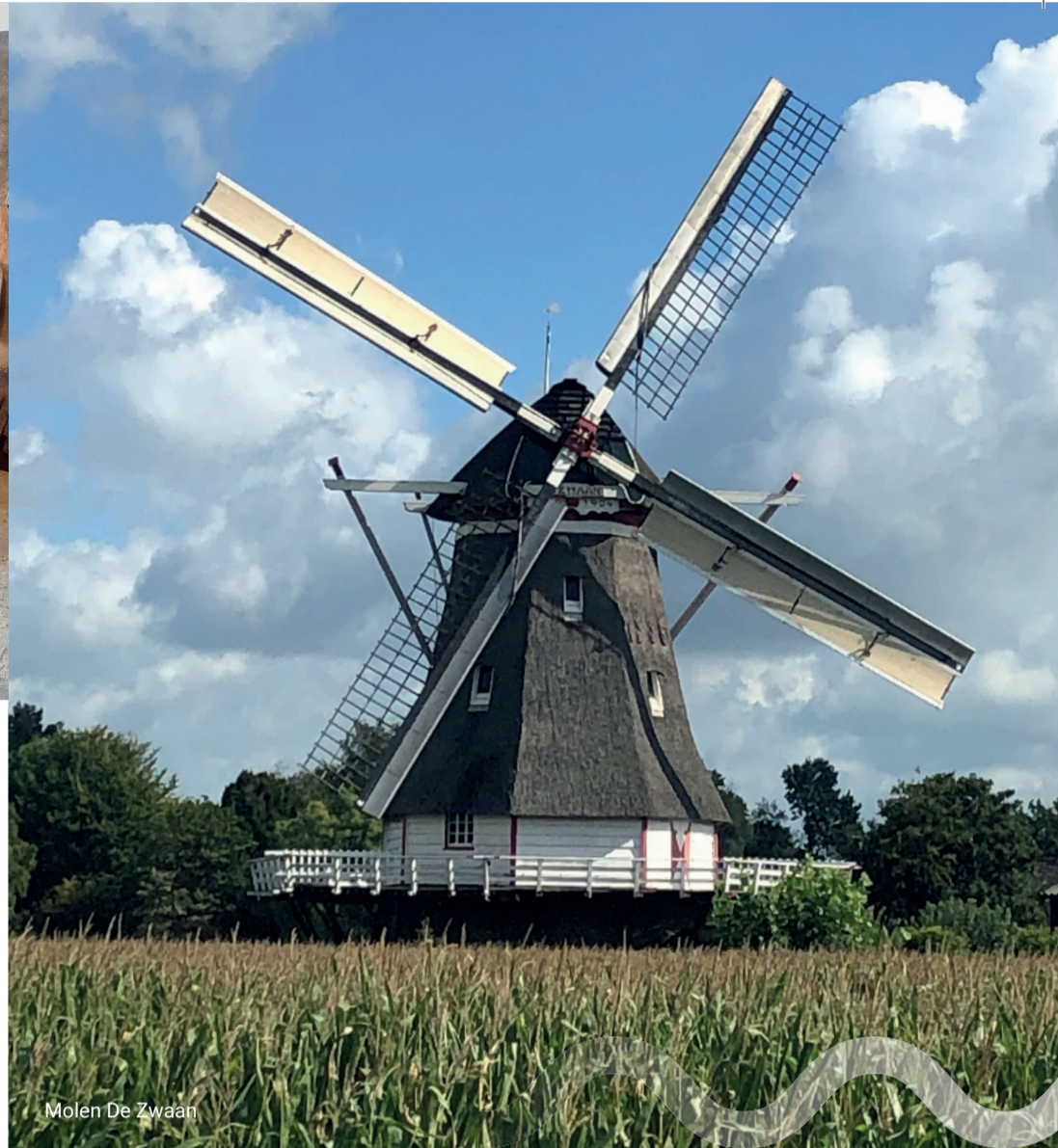
Molen De Zwaan