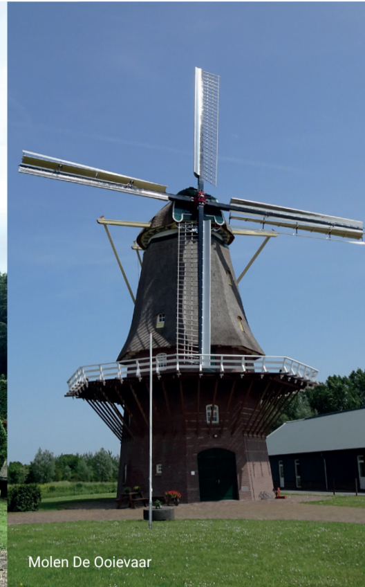
Molen De Ooievaar