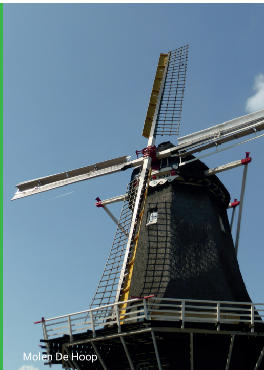
Molen De Hoop

Molen De Ooievaar kent een roerige geschiedenis. Maar liefst drie keer werd deze molen door brand getroffen: in 1893, in 1973 en in 2015. De molen is sindsdien herbouwd en weer volop in gebruik. Het molenwinkeltje is geopend, er is een terras en de molenaars geven rondleidingen door de molen. Op de eerste verdieping is een tentoonstelling van handgemaakte modellen van diverse Nederlandse molens te bewonderen. Ook vindt dit jaar weer het evenement 'Wieken en Wielen' plaats.