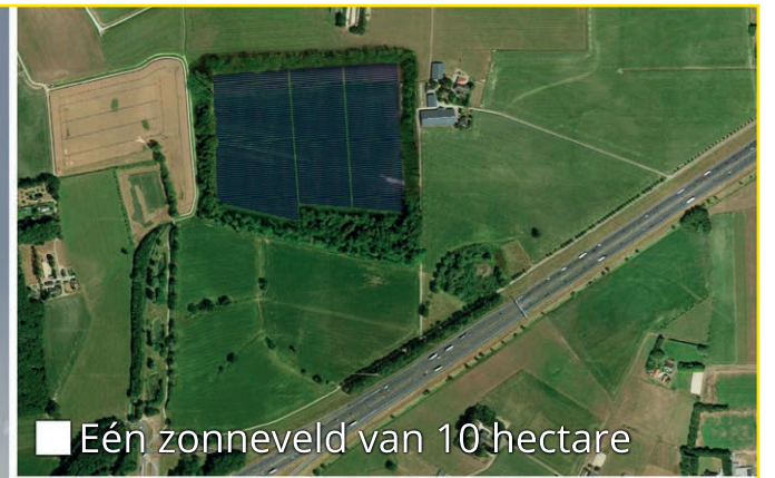
■ Eén zonneveld van 10 hectare