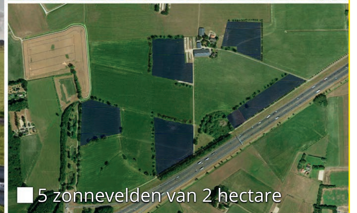
■ 5 zonnevelden van 2 hectare

Postbus 9000 - 7390 HA Twello - H.W. Iordensweg 17 - 7391 KA Twello - T. 0571 - 27 99 11 / 14 0571 - www.voorst.nl - gemeente@voorst.nl