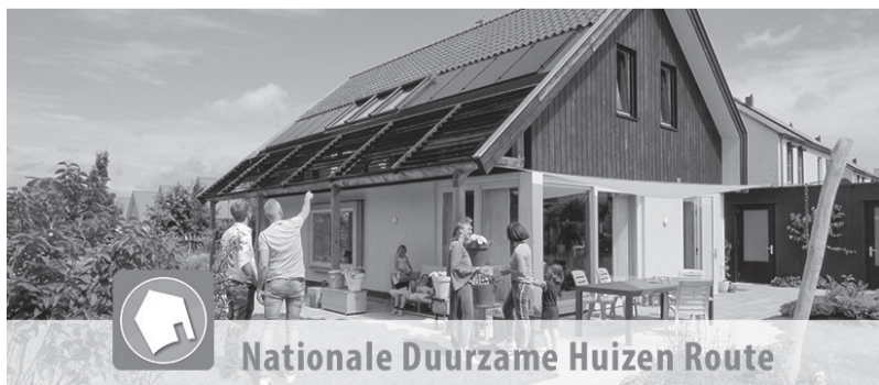
Nationale Duurzame Huizen Route

Heeft u ervaring opgedaan met het toepassen van duurzame maatregelen zoals isolatie, zonnecollectoren of bijvoorbeeld