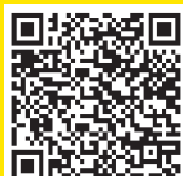
Agenda ronde-tafelgesprekken dinsdag 2 juni

Alle gesprekken kunt u live volgen (beeld + geluid) via de website van de gemeenteraad: voorst.raadsinformatie.nl . Scan de QR-codes met u smartphone of tablet-computer om de agenda en de vergaderstukken online te bekijken