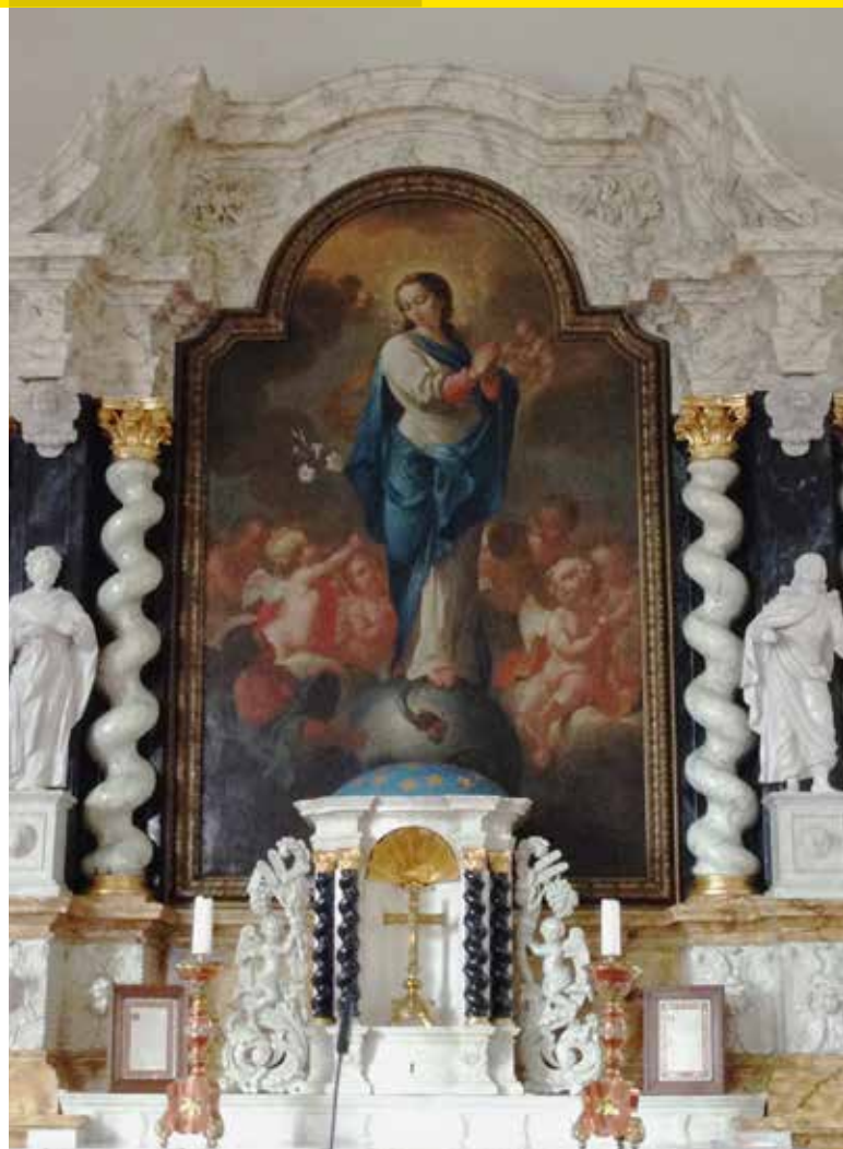
Interieur St. Martinuskerk