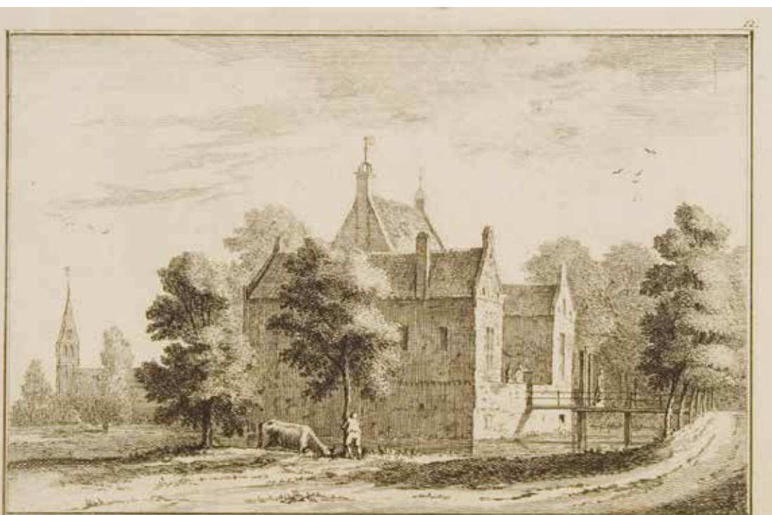
GEZIGT VAN EEN ADELIGHUIS IN GELDERLAND.

Dit transformatorhuisje werd gebouwd tussen 1920–1930 in opdracht van de Provinciale Geldersche Electriciteits-Maatschappij (PGEM) naar het type B3R van G. Versteeg. Dit type is beïnvloed door de architectuur van de Nieuwe Haagse School. De kleuren zwart en geel in het metselwerk verwijzen naar de Gelderse kleuren.