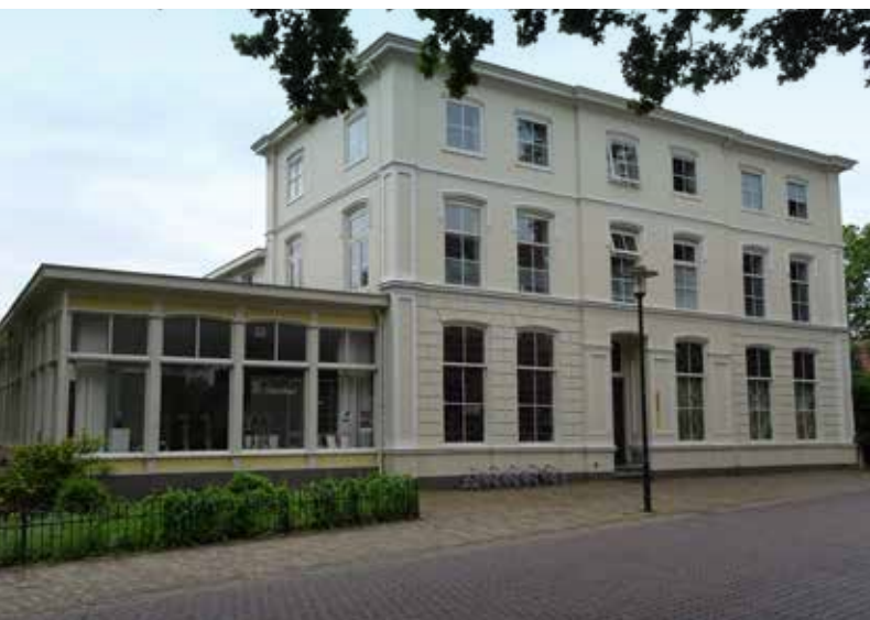
Hof te Dale

www.voorst.nl/open-monumentendag www.openmonumentendag.nl