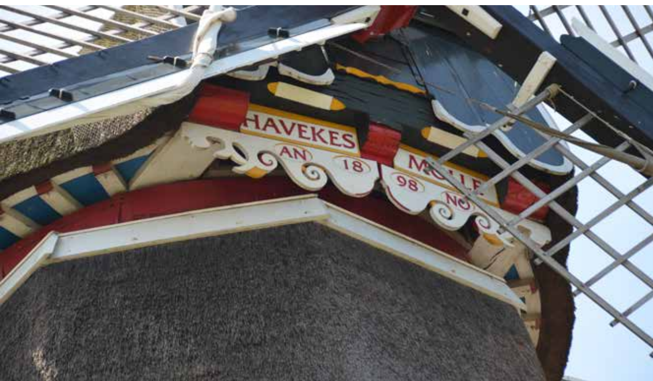
Havekes Mølle (detail)