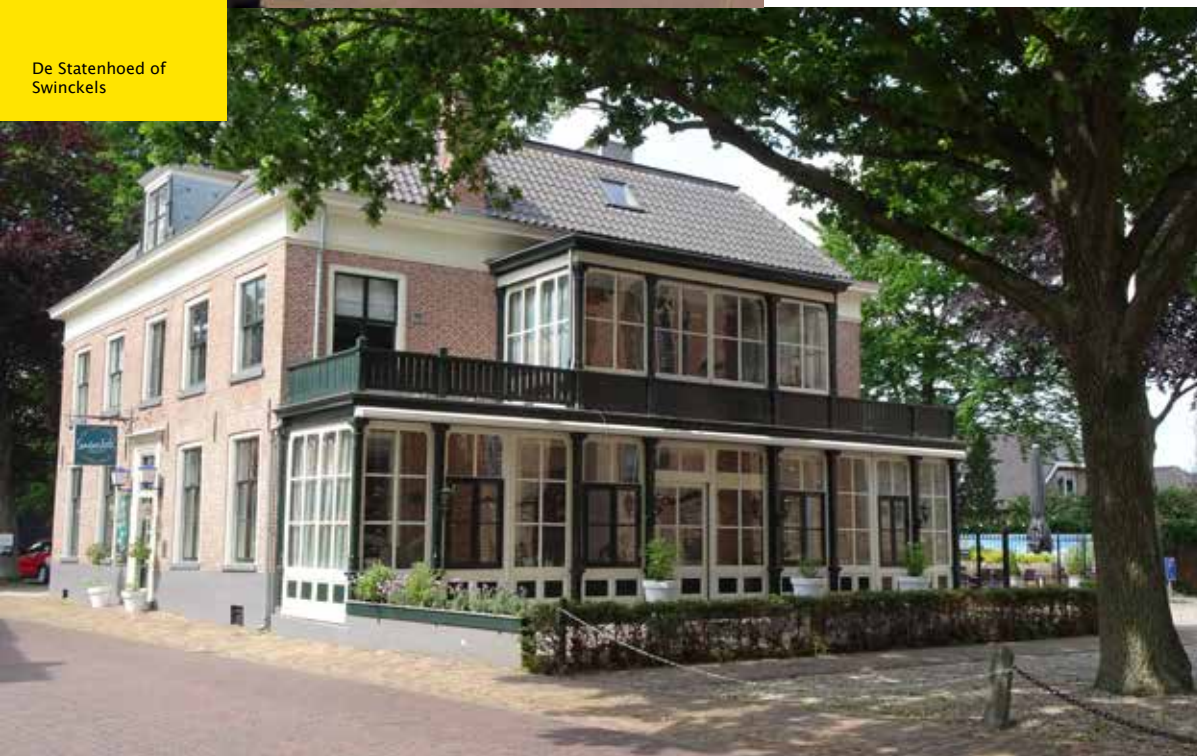
De Statenhoed of Swinckels